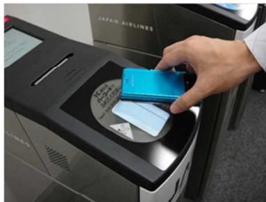
（読み取り機にタッチして登録情報を確認）

会員情報への登録により、 障害者割引の航空券をインターネットで購入した場合でも、チェックイン時に障害者手帳を提示する必要はなく、直接保安検査場へ行くことも可能。