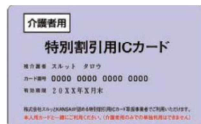
（スルッと KANSAI 特別割引用 ICカード）